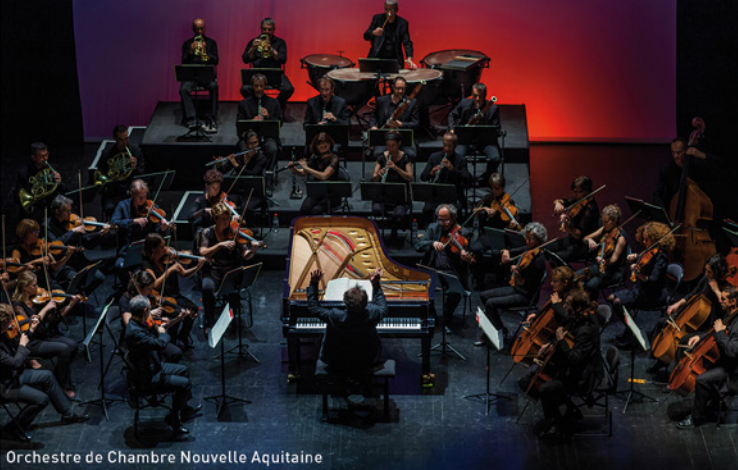
Orchestre de Chambre Nouvelle Aquitaine