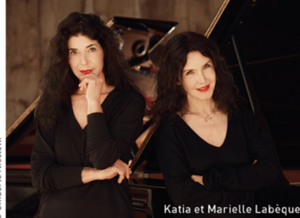
Katia et Marielle Labèque